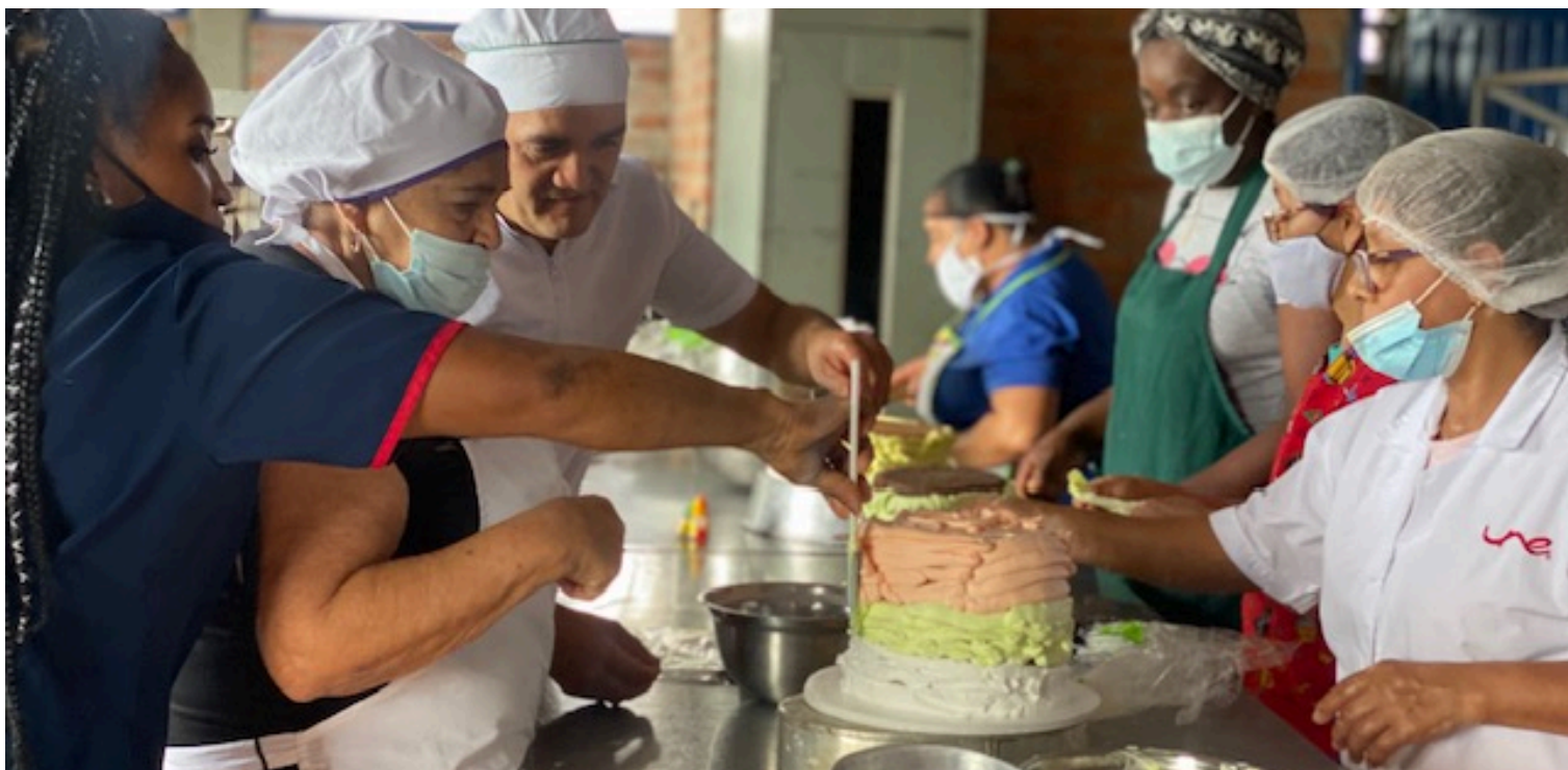
Taller de panadería.

Uno de los principales objetivos de nuestra acción en Pereira es ofrecer a las mujeres la oportunidad de adquirir unos conocimientos básicos con los que puedan acceder a un trabajo digno y con mayor retribución. Durante el año 2024, la participación de las mujeres en los cursos ofrecidos ha sido mayoritaria. Y es que del total de participantes en los cursos, el 95% son mujeres .